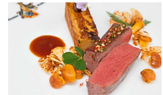
MAIBOCKRÜCKEN MIT DÖRROBSTPOLENTA UND KARAMELLISIERTEM BLUMENKOHL Dieses Rezept finden Sie auf der Seite 250